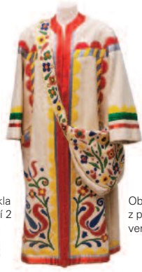
Obušku z pytle ven