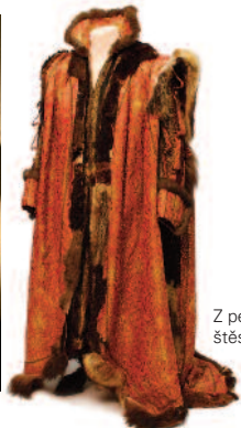
Z pekla štěstí 2