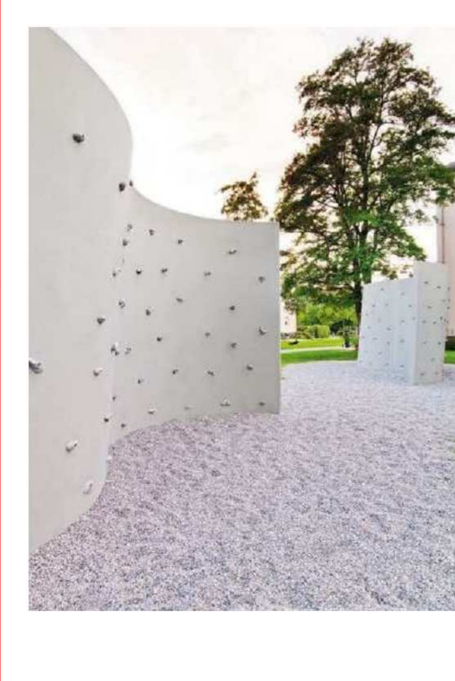
VENKOVNÍ LEZECKÁ STĚNA vč. dopadové plochy - stovky tisíc Kč