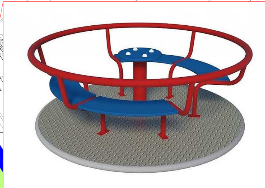
3+ KOLOTOČ KARUSEL - 50 000 Kč