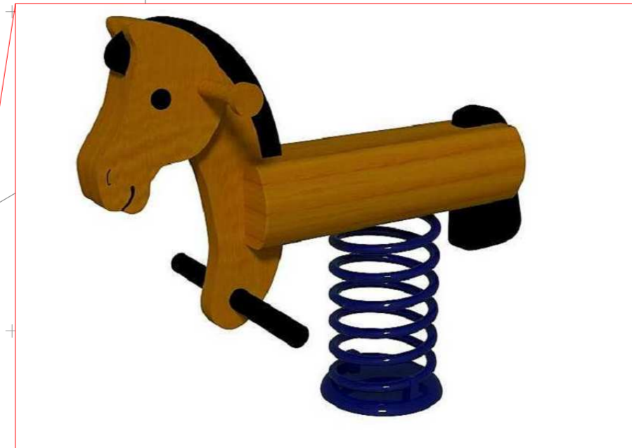
3+ PROSTOR PRO PRUŽINOVÁ HOUPADLA - 50 000 Kč