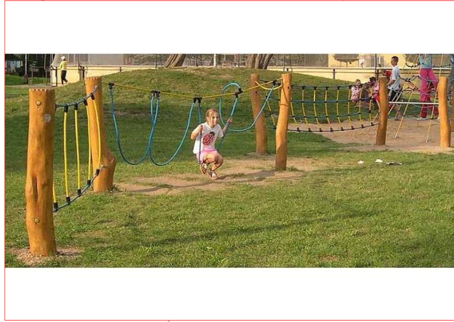
3+ LANOVÁ STEZKA ODVAHY - 50 000 Kč