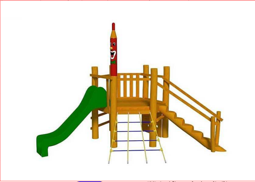
3+ MULTIFUNKČNÍ SESTAVA JUPITER - 90 000 Kč