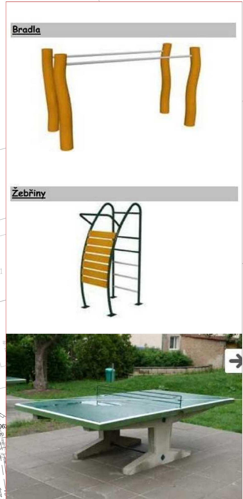
PROSTOR PRO: *STOLY PRO STOLNÍ TENIS - 30 000Kč *SPORTOVNÍ PRVKY - BRADLA, ŽEBŘINY - 50 000 Kč