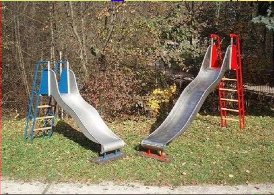
7+ PROSTOR PRO NEREDIVÉ SKLUZÁVKY - 100 000 Kč