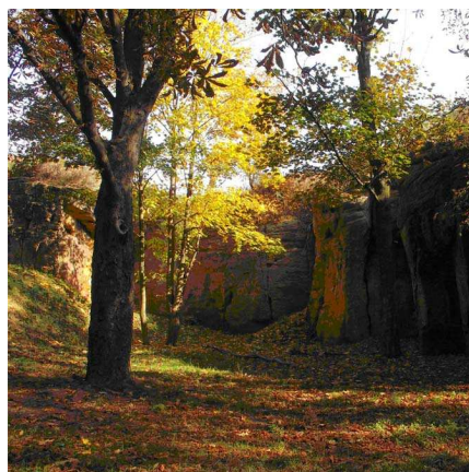
pískovcové skály nad rybníkem Velká Obůrka