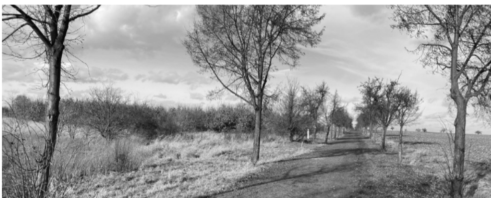
Cesta mezi Vinohrady a Přežleticemi

k Praze a „soudruzi z NDR někde udělali chybu“. Tyto pozemky, ač v katastru Vinohrady, zůstaly v majetku obce Přežletice. Co to prakticky znamenalo? Přežletice měly majetek, který pro ně nic nepřinášel (těžko si postaví zastávku MHD uprostřed Vinohrady), a Vinohrady, když chtěla něco postavit,