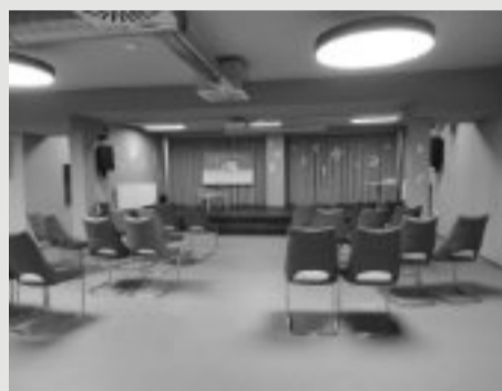
Společenský sál Pod Normou